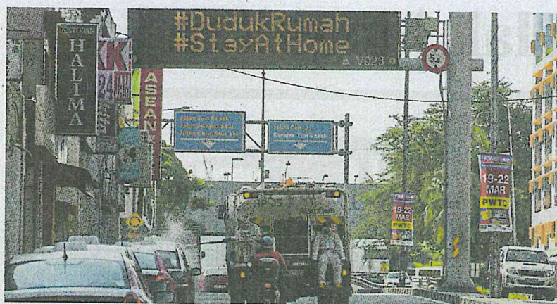
Pekerja Alam Flora melakukan semburan nyah cemar sekitar kawasan Pasar Pudu bagi mengekang penularan wabak COVID-19.