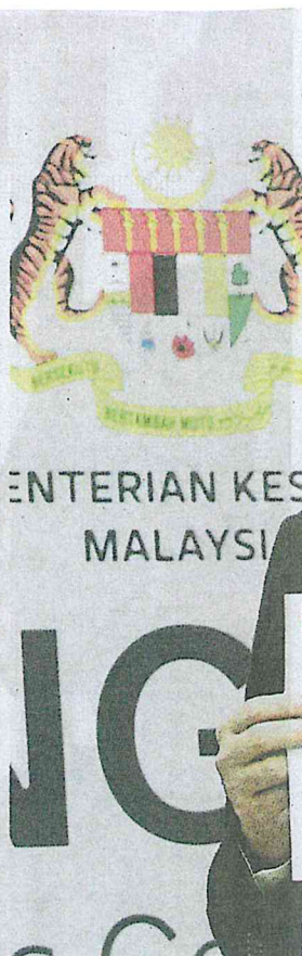
Health director-general Datuk Dr Noor Hisham Abdullah with a chart showing the number of Covid-19 cases in the country, in Putrajaya yesterday.

He said there were 334 quarantine centres housing more